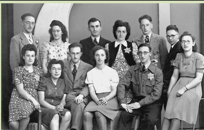
Een groep Joodse stadsgenoten die gedwongen waren een davidster te dragen

Halverwege de wandeling bezoeken wij het gebouw van Apostolisch Genootschap waar een tentoonstelling te zien is over Meppel in de tweede Wereld Oorlog.